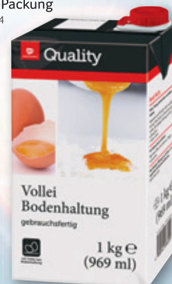
Vollei 1-kg-Packung 496 384