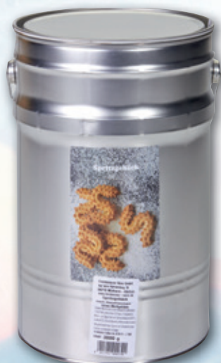
Feinbäckerei Rünz Spritzgebäck 3-kg-Eimer 813 891