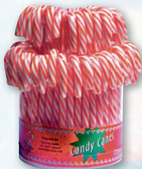
Tri d Aix Candy Canes 72-Stück-Dose 431 290