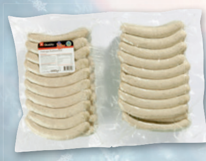
Quality Original Thüringer Rostbratwürste 6-kg-Packung 384 712