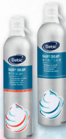
Debic Profi- Sprühsahne gezuckert oder ungezuckert 700-ml-Dose 928 205